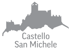
Castello San Michele